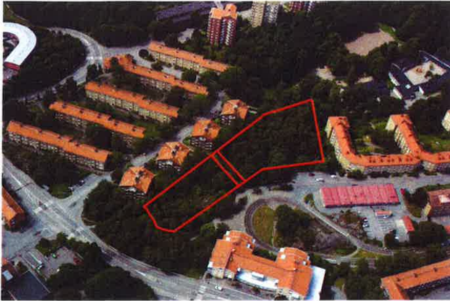
Snedbild från öster