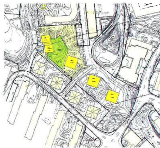
Skiss till ansökan