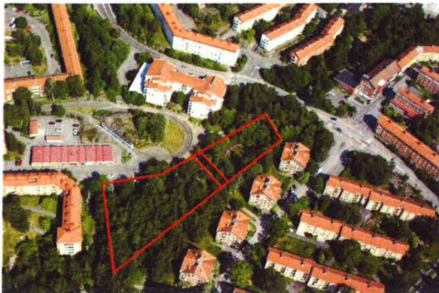
Snedbild från väster