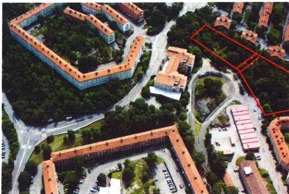
Snebild från norr