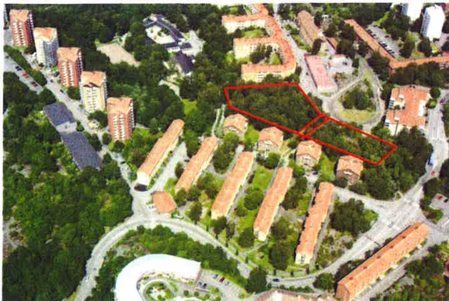
Snebild från söder