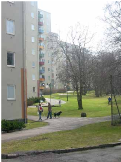
Bilder från Syster Ainas park och från kickeplan. Nedan en samling på aktuell parkeringsplats under en stads-/grönvandring i det tidiga samrådet. Till höger del av förskolan vid Mossebersskolan